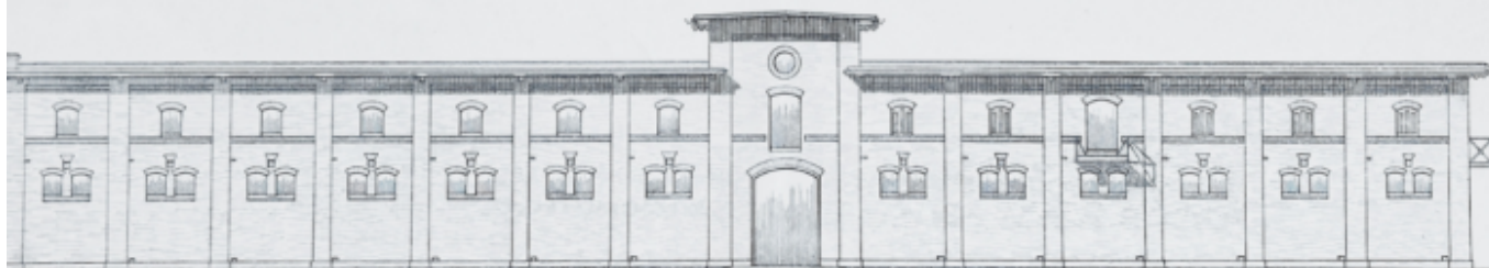
Worder - Ansicht.