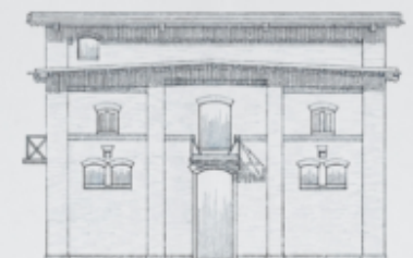
Giebel - Ansicht.