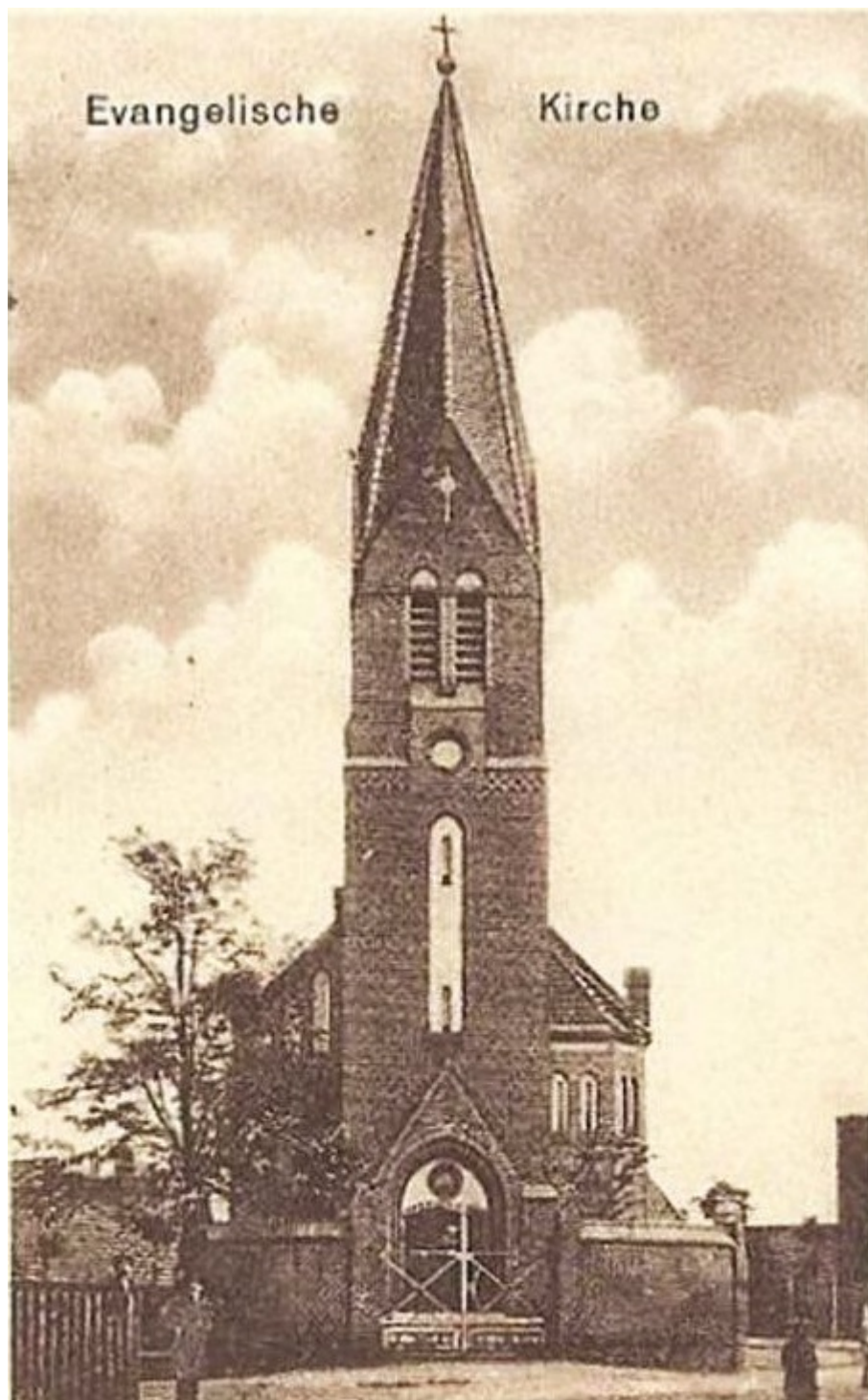
2. Fragment pocztówki z początku XX w.