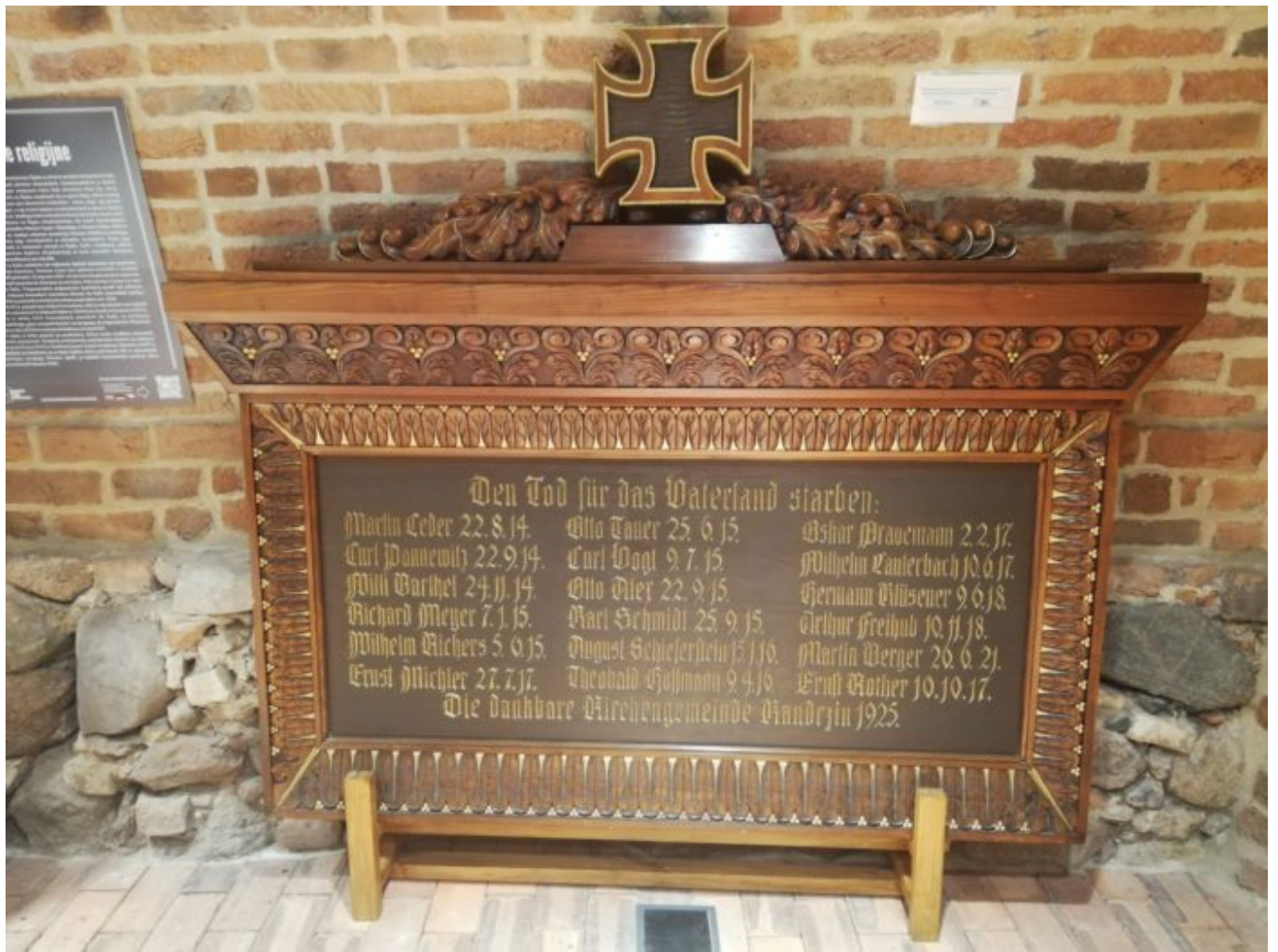
1. Tablica z kościoła ewangelicko-augsburskiego w Kędzierzynie